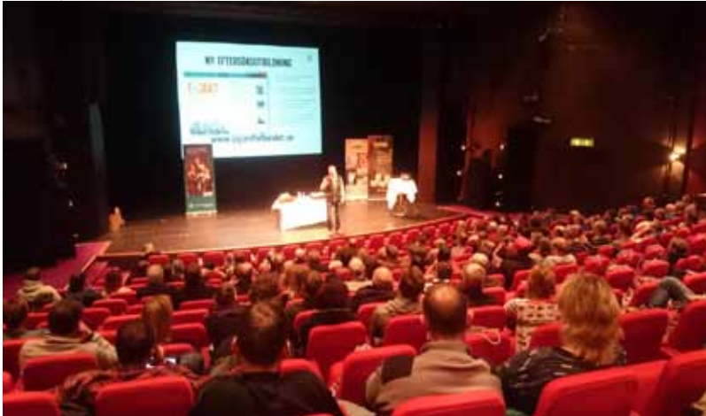
I Stora salongen på Storsjöteatern i Östersund samlades cirka 200 personer för att lära sig mer om eftersök.