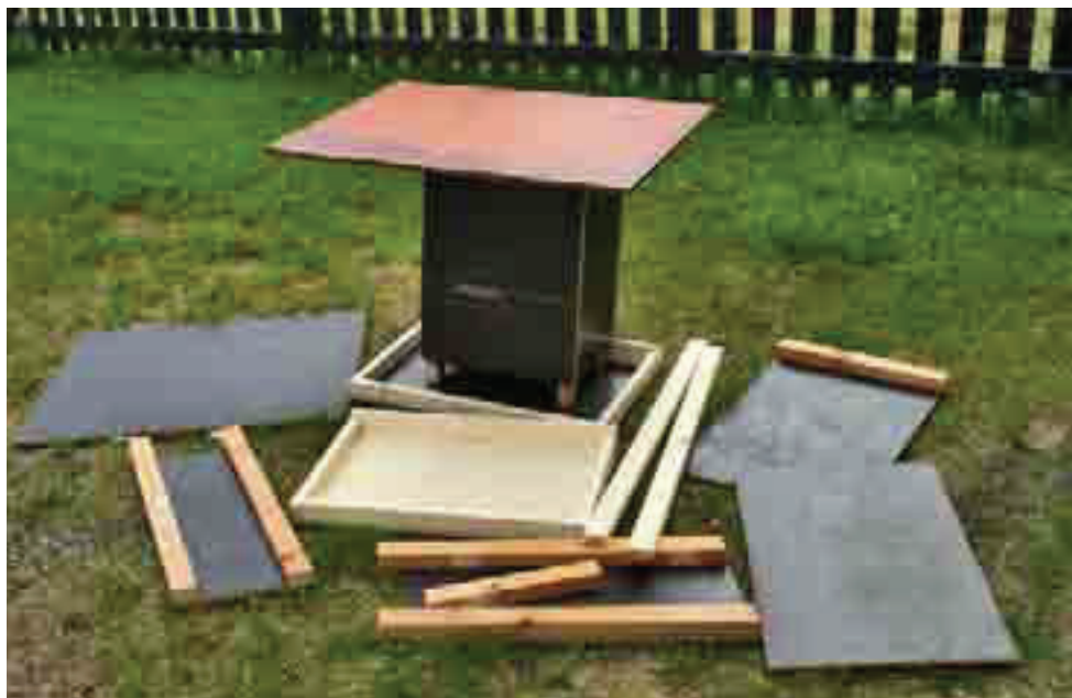
När man bygger foderautomater är det klokt att först såga till allt virke. Hopsättningen med trallskruv och skruvdragare går sedan fort.