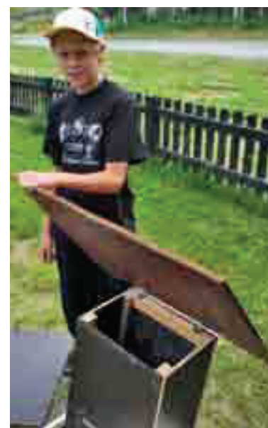
Foderautomaten kan också byggas av oljehärdad masonit men taket bör alltid vara av byggplywood.

Innan snön kommer och utfodrings-säsongen drar i gång kan det vara klokt att se över foderautomaterna. Några gamla har kanske tjänat ut och behöver bytas. Ibland behöver också nya sättas upp. Månadens viltvårdstips visar hur du bygger en bra, billig och funktionell foderautomat för rådjur.