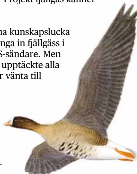
ILLUSTRATION: HANS LARSSON