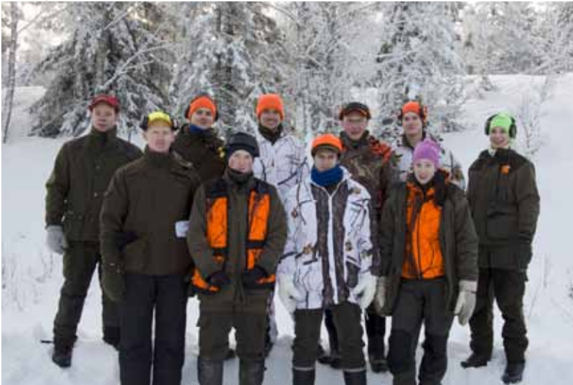
Tio vinnare i Svensk Jakts tävling fick en delta i en klövviltjakt.