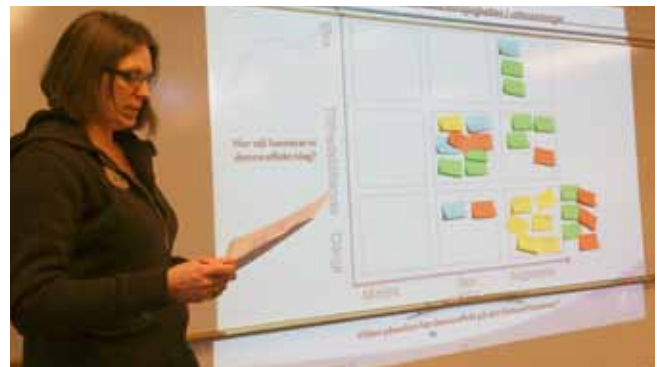
Jägareförbundet Gävleborg den 19 januari.

När alla workshopar och intervjuer är klara påbörjas sammanställningen av allt material. Därefter kommer styrgruppen i projektet (förbundsstyrelsen) analysera och stämma av vilket material som går vidare in i etapp 2 (som handlar om vision och mål).