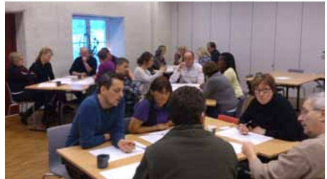
Omfattande diskussioner på Öster Malma.

När man leder en workshop så slås man av vilken energi och framåtanda deltagarna ger sig i kast med uppgifterna. Det är likadant oavsett om det gäller personal eller kretsar. Det är riktigt kul. Jag tror det här kommer att bli jättebra. För vi har fått en riktigt bra start.