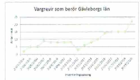
Fig 4 Detta figur visar det totala antalet revir (Måstads familjegrupp) revirmarkeringar på och en annan etablerade varg i Gävleborgs län (n. 2020/2024 län 2019/2020)