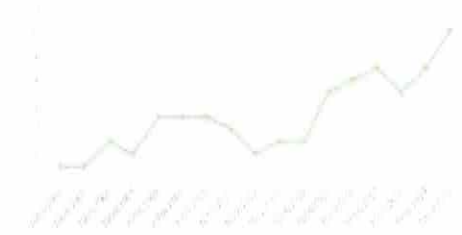
Fig 5 Detta figur visar antalet vargföreningar som berör Gävleborgs län (berör av flera föreningar omfattas med andra län)