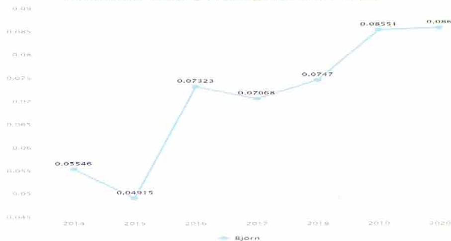
Rovdjursobs per 100 mantimmar: Rovdjursobs per 100 mantimmar björn Gävleborgs län 2014-2020