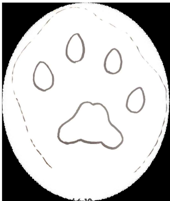
Lodjursspår – asymmetriska tår

Det krävs bra spårförhållanden för att genomföra inventeringen och att den ska bli bra. Jägareförbundet och länsstyrelsen beslutar under veckan att det finns förutsättningar för inventering.